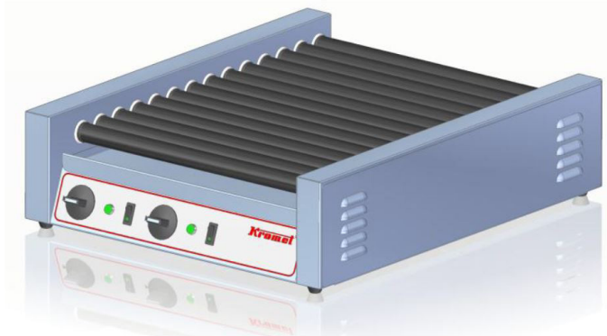
Rullgrill med två uppvärmningszoner

Apparaterna kan användas i små gastronomiska anläggningar såväl som i stora restauranger etc.