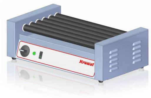
Rullgrill med en uppvärmningszon